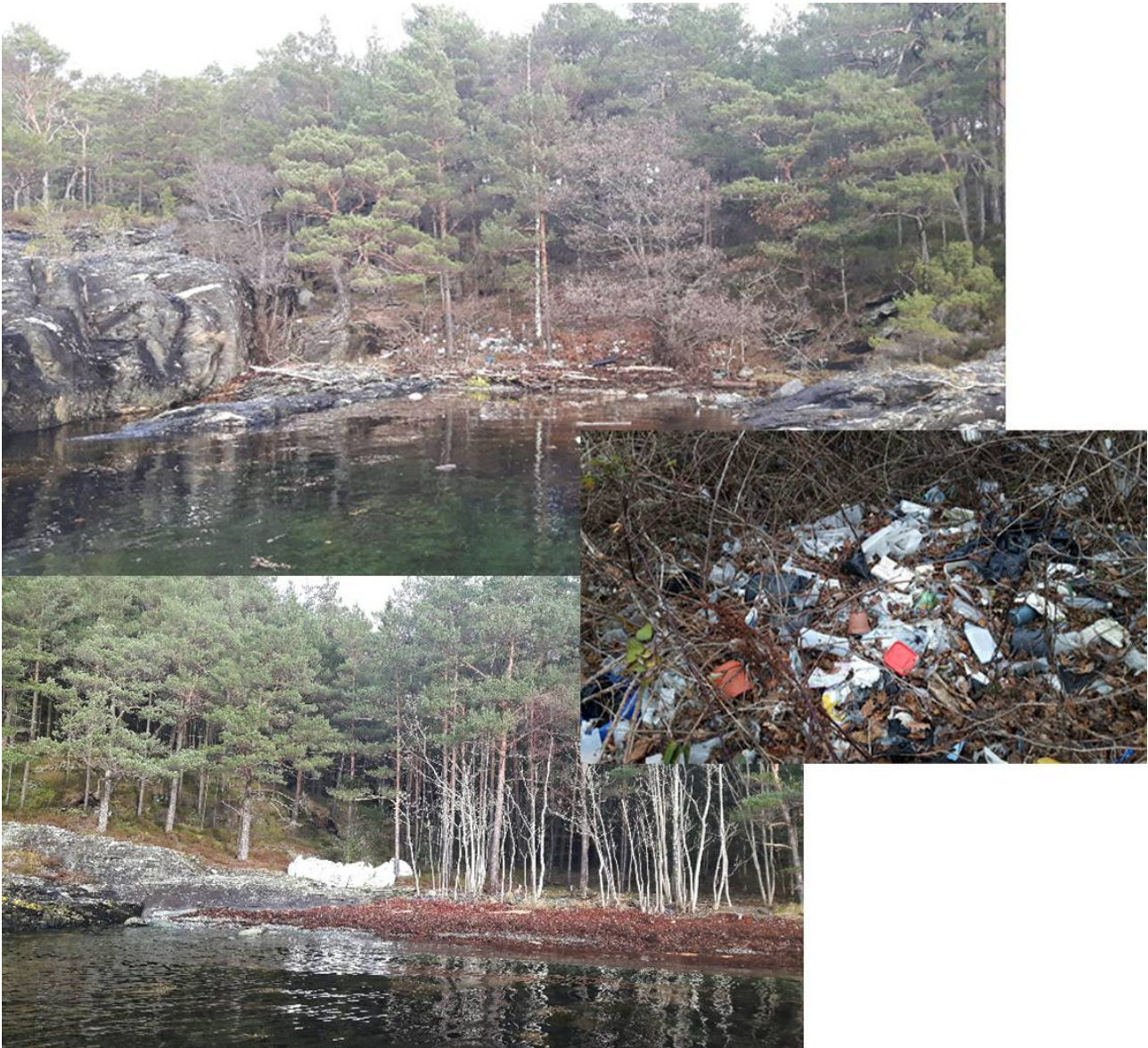
Figur 2. Strand-rydding har vist at det finnes mye plast og annet søppel på strender i området som sannsynlig har hopet seg opp over lang tid (Foto BE Grøsvik, Havforskningsinstituttet).